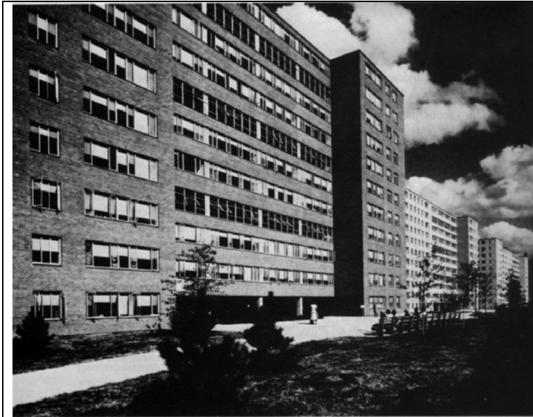
Pruitt-Igoe Public Housing, St Louis, Mo.